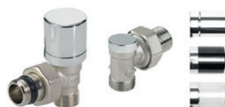
Set Basic valvola e detentore Basic valve and detentor set