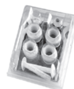
Kit tappi, riduzioni e mensole Caps, adaptors and brackets kit