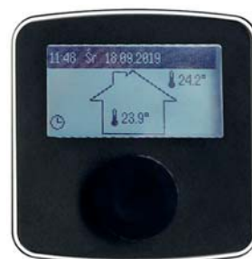
Einfach zu bedienende Kesselkreisregelung

Vitotron 100 verfügt über ein 5-Liter-Membran-Ausdehnungsgefäß und die erforderlichen Sicherheitsvorrichtungen. In Kombination mit einem Warmwasserspeicher ist es möglich, die Wassertemperatur entsprechend den Tages- und Wocheneinstellungen zu regeln und eine Umwälzpumpe zu steuern.